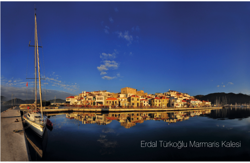
Erdal Türkođlu Marmaris Kalesi