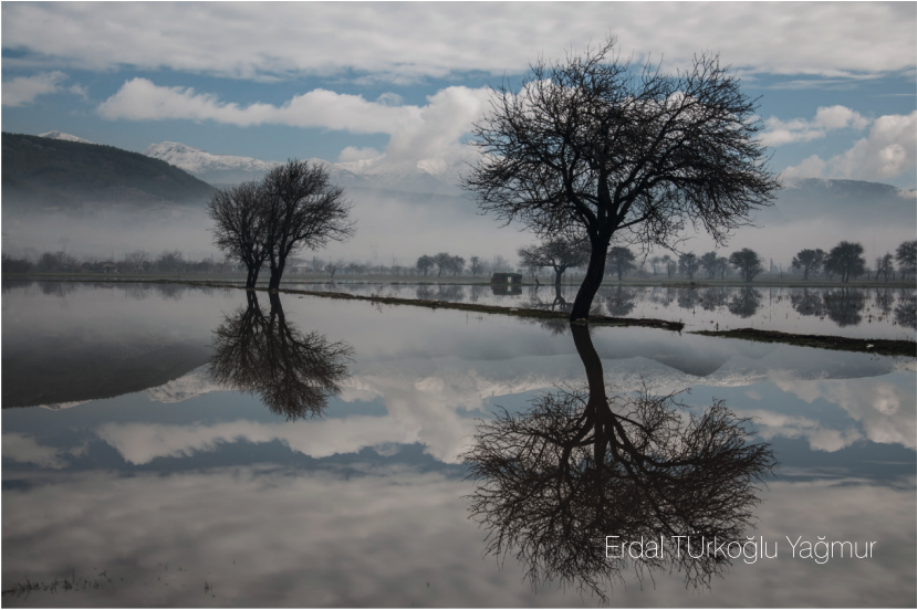
Erdal Tırkođlu Yađmur