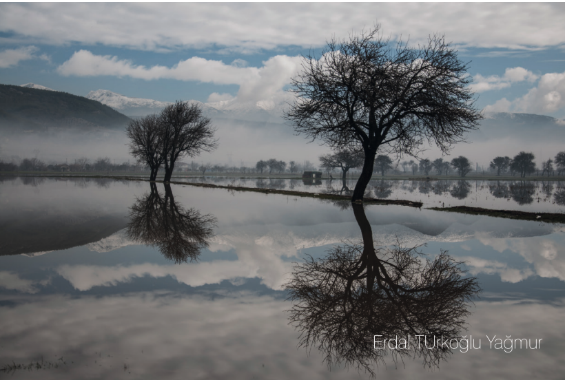
Erdal Turkođlu Yađmur